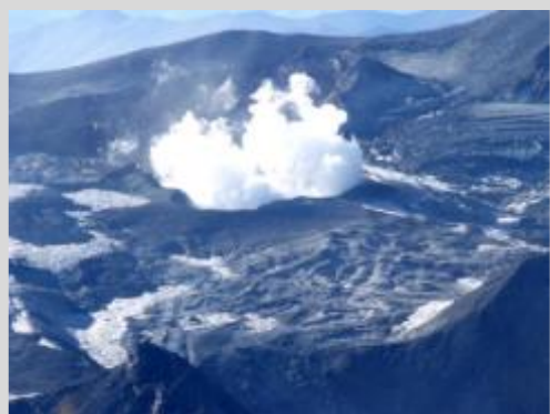
Vista Oblicua del Volcán Planchón